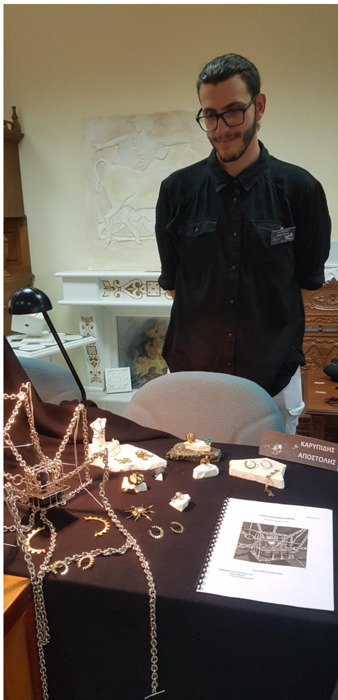
Θέμα πτυχιακής εργασίας «Λεκτική Βία»