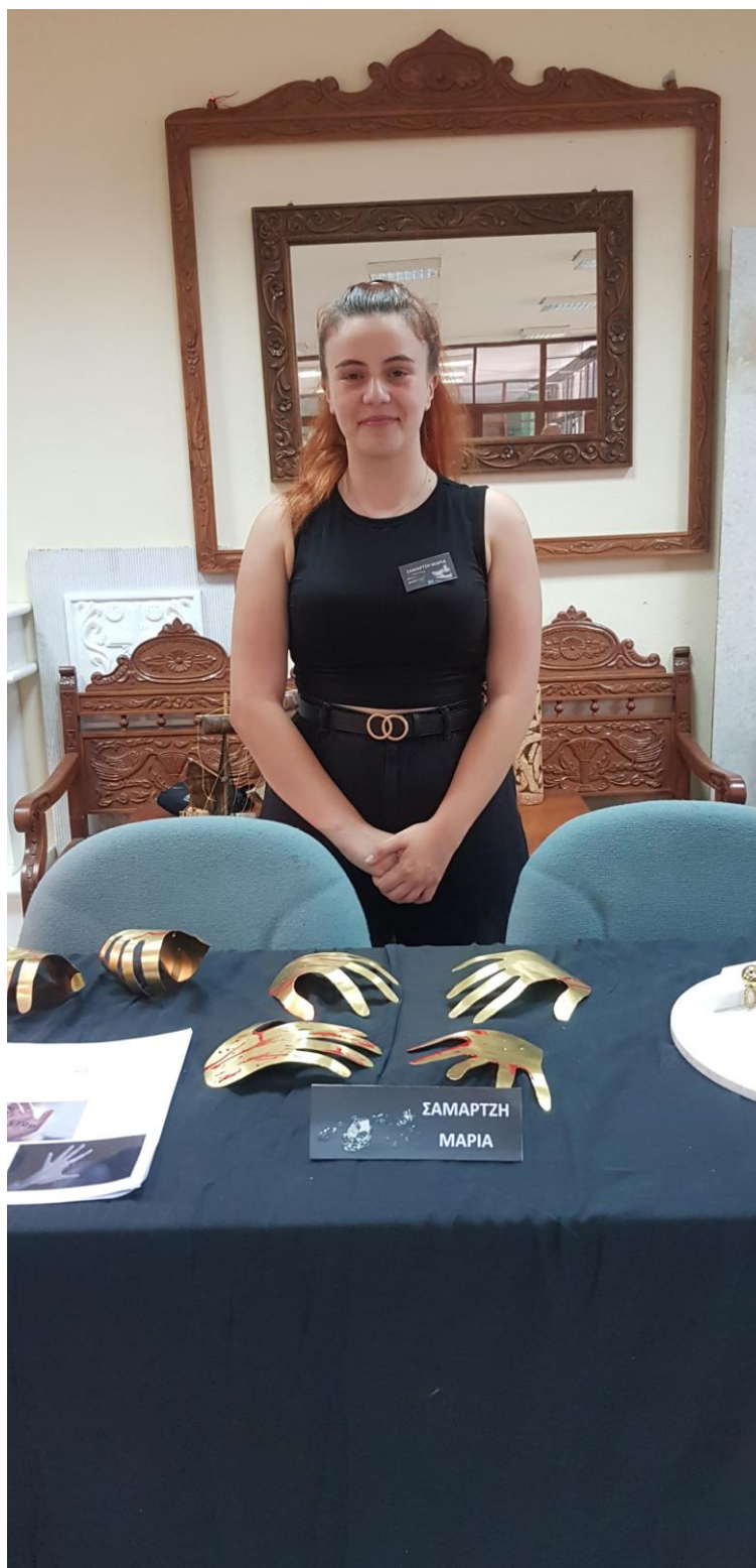
Θέμα πτυχιακής εργασίας «Σωματική Βία»