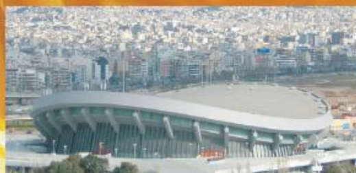
ΣΤΑΔΙΟ ΕΙΡΗΝΗΣ & ΦΙΛΙΑΣ