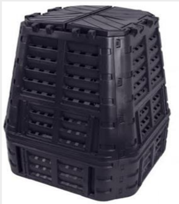
Εικόνα 1. Κομποστοποιητής χωρητικότητας 740 L και διαστάσεων 933x933x1130 mm

Για περισσότερες πληροφορίες ή διευκρινίσεις, μπορείτε να επικοινωνείτε με το Κέντρο Υποστήριξης Επιχειρήσεων στην ηλεκτρονική διεύθυνση: agrofficiency@veth.gov.gr και τηλέφωνο: 2310-241.383 και με το ΙΜΕ / ΓΣΕΒΕΕ στο τηλέφωνο: 2310-545.967.